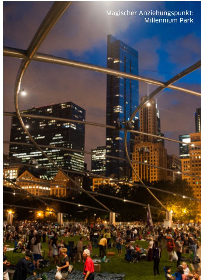
Magischer Anziehungspunkt: Millennium Park