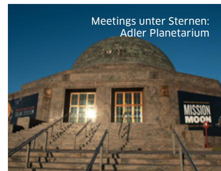
Meetings unter Sternen: Adler Planetarium