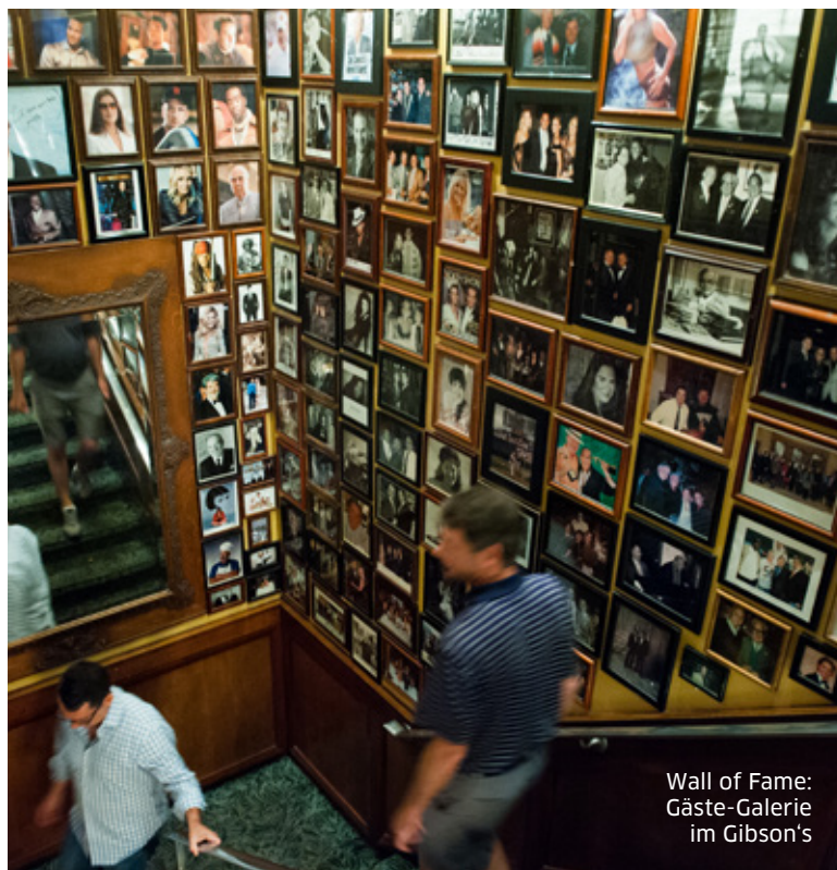
Wall of Fame: Gäste-Galerie im Gibson's