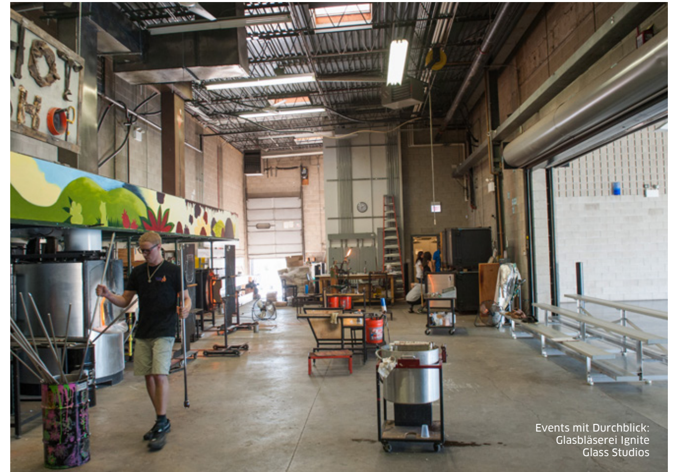
Events mit Durchblick: Glasbläserei Ignite Glass Studios