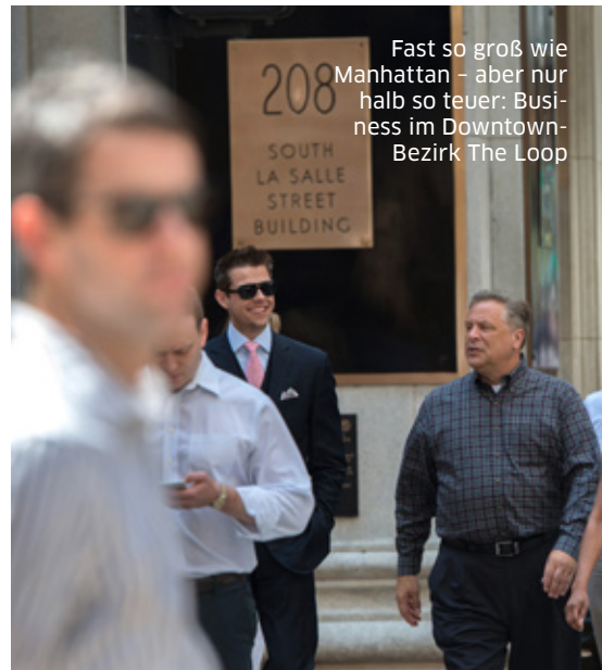
Fast so groß wie Manhattan – aber nur halb so teuer: Business im Downtown-Bezirk The Loop