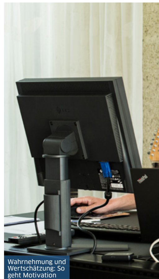
Wahrnehmung und Wertschätzung: So geht Motivation

Millionen in der Kasse. Man darf also nicht naiv sein. Sollte es doch zu einem Missbrauch kommen, wird das Geschäft des Hotelchefs nicht gleich den Bach runtergehen. Man muss also angemessen handeln und den Raum der Selbsterhaltungsvernunft nicht verlassen.