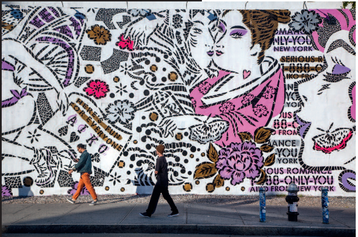
Oben: Großes Graffiti von Aiko in der East Houston Street/Ecke Bowery