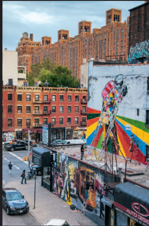
Links: Arbeiten des Künstlers Kobra neben dem High Line Park, einer früheren Hochbahntrasse Unten: Der Zaun in der 42 Bond Street zeigt – im richtigen Winkel betrachtet – den verstorbenen Apple-Chef Steve Jobs