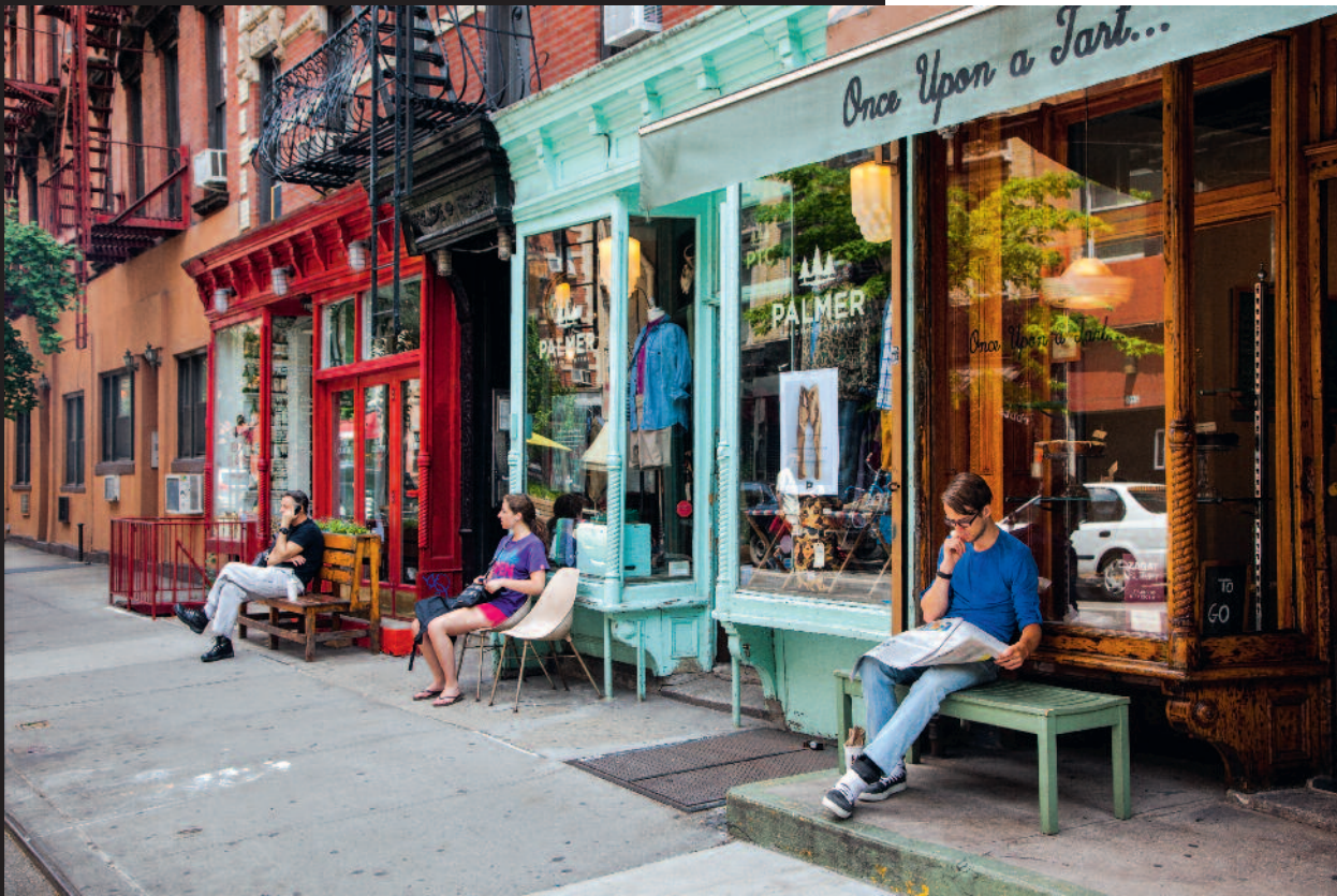
Oben: Die Eigner des Cafés „Once upon a Tart“ in Sohos Sullivan Street sind froh, dass ihre Front graffitifrei geblieben ist Rechts: Porträt der Sängerin Amy Winehouse am 5 Pointz Art Center in Long Island City