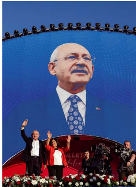
Kann er gewinnen? Herausforderer Kemal Kılıçdaroğlu trägt den Spitznamen „türkischer Gandhi“