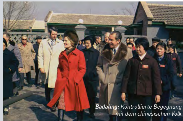
Badaling: Kontrollierte Begegnung mit dem chinesischen Volk

Ausflug an die Chinesische Mauer: In Begleitung von Vizepremier Li Xiannian fahren die Nixons nach Badaling, 60 Kilometer von der Kernstadt Peking entfernt, um den dortigen Abschnitt der Großen Mauer zu besichtigen. Daran schließt sich ein Besuch bei den Gräbern der Kaiser der Ming-Dynastie an. Sie erreicht man über den „Weg der Seelen“ (shendao). An ihm sind beidseitig paarweise steinerne Menschen- und Tierskulpturen aufgereiht – Symbole für die Ehrengarde des Kaisers. Am Nachmittag treffen sich Nixon und Chou erneut zu dreistündigen Gesprächen. Es folgt ein weiteres Abendessen in der Großen Halle des Volkes.