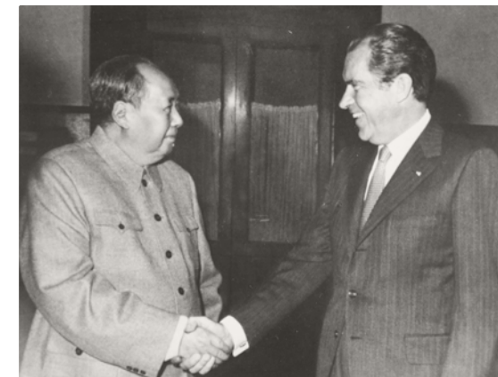
Weiterer Handschlag: Richard Nixon trifft Mao Tse-tung. Der „Überragende Führer“, so einer seiner zahlreichen Ehrentitel, vertrat einen Brutalo- Kommunismus, den am Ende etwa 70 Millionen Chinesen mit dem Leben bezahlen mussten