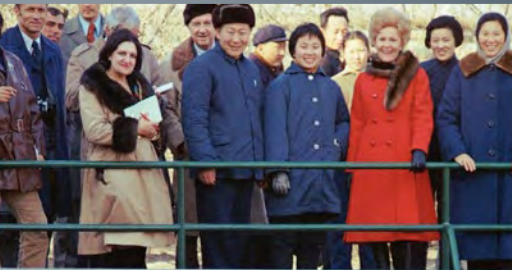
Besichtigung der kaiserlichen Vergangenheit des Landes: Pat Nixon im Sommerpalast der chinesischen Kaiser