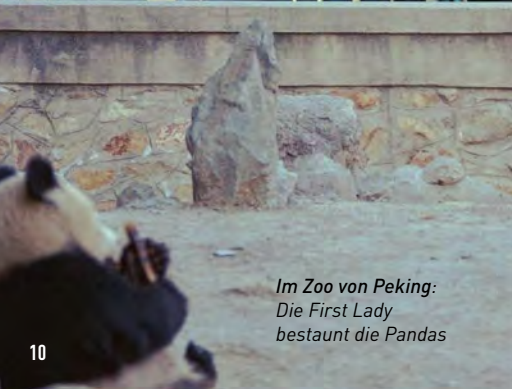
Im Zoo von Peking: Die First Lady bestaunt die Pandas