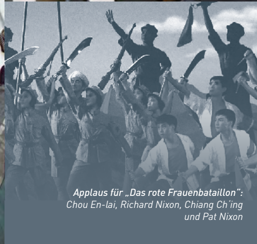
Applaus für „Das rote Frauenbataillon“: Chou En-lai, Richard Nixon, Chiang Ch'ing und Pat Nixon

Mit Beginn der Kulturrevolution mussten ab 1962 die traditionellen Peking-Opern vom Spielplan verschwinden. Für die Umstrukturierung des Bühnenkanons war Maos damalige vierte (und letzte) Ehefrau Chiang Ch'ing verantwortlich, eine ehemalige Schauspielerin. Am Ende durften nur noch acht Werke („Modellopern“) aufgeführt werden: fünf Opern, zwei Ballette, eine Symphonie. Eins davon war das Ballett „Das rote Frauenbataillon“. Es handelt von einem jungen Mädchen, das sich dem Frauenbataillon der Roten Armee anschließt, um gegen nationalistische Truppen zu kämpfen