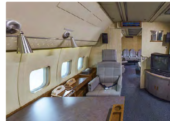
Das Innere der Maschine 1998. Links der Ledersessel des Präsidenten

Kennedy war es auch, der im Oktober 1962 mit dieser Boeing 707 den Jungfernflug unternahm – die ihn zudem im Juni 1963 zu seinem unvergessenen Besuch nach West-Berlin brachte („Ich bin ein Berliner“). Aber er flog mit ihr im gleichen Jahr auch zu seinem schicksalhaften Besuch nach Dallas. In dieser Maschine wurde am 22. November 1963 sein Sarg zurück nach Washington, D.C., transportiert – und in ihr wurde noch während des Flugs Lyndon B. Johnson als neuer Präsident vereidigt.