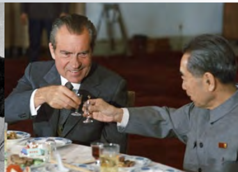
Ein Toast auf die Aufnahme baldiger diplomatischer Beziehungen: Nixon und Chou