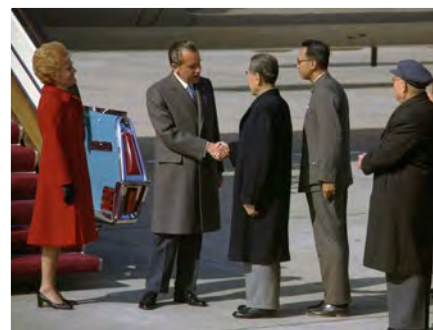
Erster Handschlag: Der chinesische Premier Chou En-lai begrüßt Richard Nixon

nach führt er in der Großen Halle des Volkes für eine weitere Stunde Gespräche mit Premierminister Chou und anderen chinesischen Beamten. Am Abend geben die Chinesen für die Amerikaner ein Bankett in der Großen Halle des Volkes.