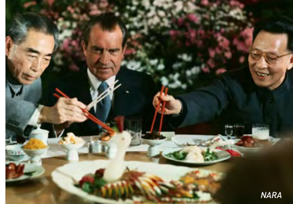
Ein weiterer Abend, ein weiteres Bankett