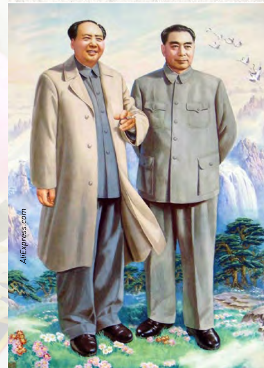
Propaganda in Pastell: Ölgemälde aus dem Jahr 1951. Chou, wie immer, im grauen Mao-Anzug, und Mao im blauen

In Europa wandelt er sich zum professionellen Revolutionär. Er gründet kommunistische Arbeitsgruppen, die gemeinsam marxistische Texte diskutieren, ruft die „Kommunistische Jugendpartei Chinas in Europa“ ins Leben, schreibt aber auch für chinesische Zeitungen über die deutsche Arbeiterbewegung. Seine Texte verfasst er in seiner Berliner Wohnung in der heutigen Wilmersdorfer Bundesallee 54a. 1923 nimmt er angeblich an einem Gedächtnismarsch zum Gedenken an die Ermordung von Rosa Luxemburg und Karl Liebknecht teil – wobei ihm klar geworden sein soll, dass jede Revolution eine Armee brauche.