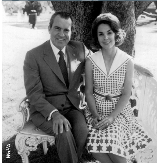
Der stolze Vater: Die „First Daughter“ Julie Nixon und ihr Vater Richard im Juni 1972 im Garten des Weißen Hauses