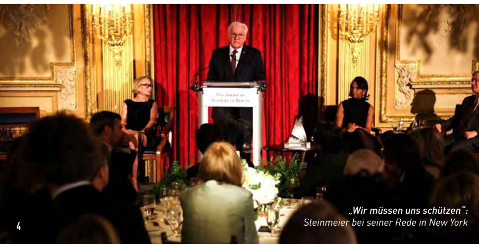
„Wir müssen uns schützen“: Steinmeier bei seiner Rede in New York

„Es war Ihre Geheimreise nach Peking, lieber Henry, es waren zwei Tage im Juli 1971, mit denen die Öffnung Chinas gegenüber dem Westen, insbesondere gegenüber den USA, begann. Es ging Ihnen, wie Sie später in Ihrem Buch ‚On China‘ schrieben, nicht um Freundschaft, sondern um etwas viel Pragmatischeres: das Ermöglichen einer Koexistenz. Diese Koexistenz ermöglicht zu haben, die Öffnung Chinas entscheidend vorangetrieben zu haben, das gehört zu Ihren unbestreitbaren, zu Ihren großen Leistungen.“