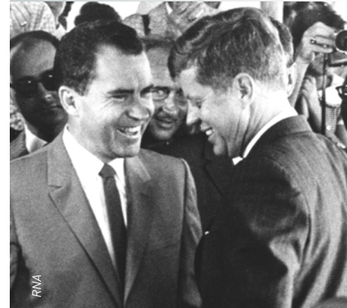
Der „Homo Politicus“: Am 14. November 1960 treffen sich Vizepräsident Richard Nixon und der designierte Präsident John F. Kennedy im Key Biscayne-Hotel in Florida, um die Details der Machtübergabe an die neue Regierung zu besprechen. Die Wahl am 8. November hatte Kennedy mit 0,1 Prozent Vorsprung nur denkbar knapp gewonnen. Das Endergebnis lautete: 49,7 zu 49,6 Prozent