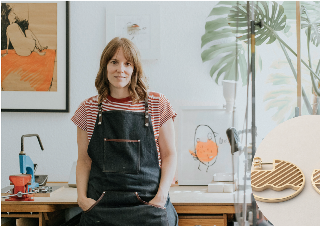
Geometrisch, nachhaltig, handgearbeitet: Ohrstecker der „Jio“-Serie